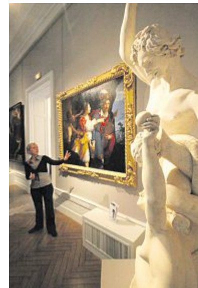
soirée : théâtre et jeux de rôle ( Mystic glue ) et visites commentées par Epic Epop.

Musée de la Reine Bérengère : 20 h, percussions africaines ; 20 h 30, guitare folk ; 21 h, violon ; 21 h 30, guitare classique ; 22 h 30, jeu autour des œuvres des musées du Mans par Epic Epop. Toute la