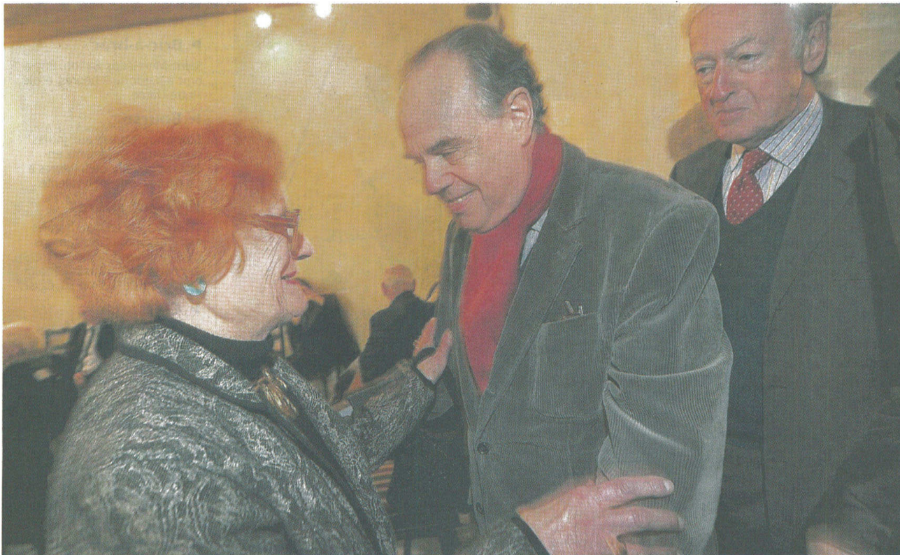
Hier au Prieuré de Vivoin. Congratulations du ministre et de l'écrivain, accueillis par le président du conseil général.